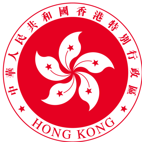
香港特別行政區區徽圖案